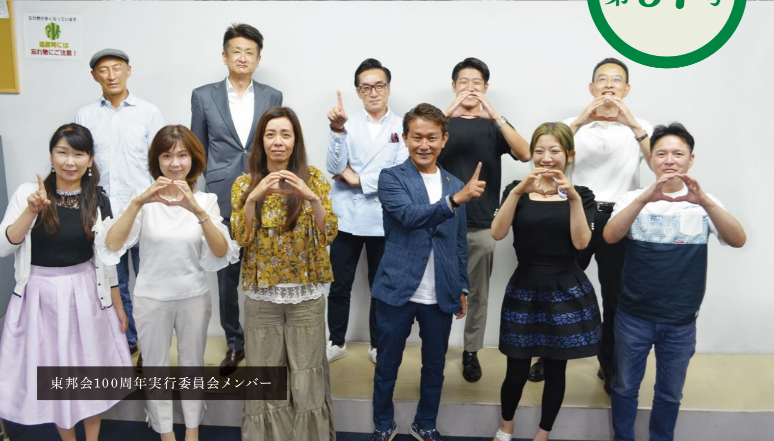
東邦会100周年実行委員会メンバー