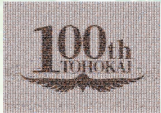
当日撮影した写真で作ったモザイクアートです